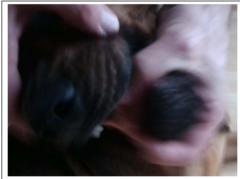
Abb. 1 So sollte es nicht sein:

Am einfachsten geht es, wenn die jungen Hunde von Anfang an daran gewöhnt werden, auf ein Kommando wie z. B. „zeig die Zähne“ das Hineinfassen in den Fang und das Fangöffnen durch den Hundeführer zuzulassen. Dann geht es später ganz ohne Probleme.