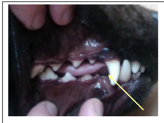
Abb. 4 Hier sitzt der Prämolalar 1

Die Übung hierfür ist Auseinanderziehen der Lefzen.