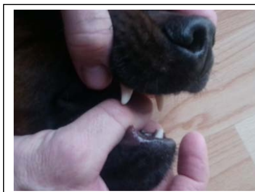
Abb. 2 Hier kann man nichts erkennen.

Bei der Gebisskontrolle werden zwei Schwerpunkte kontrolliert: